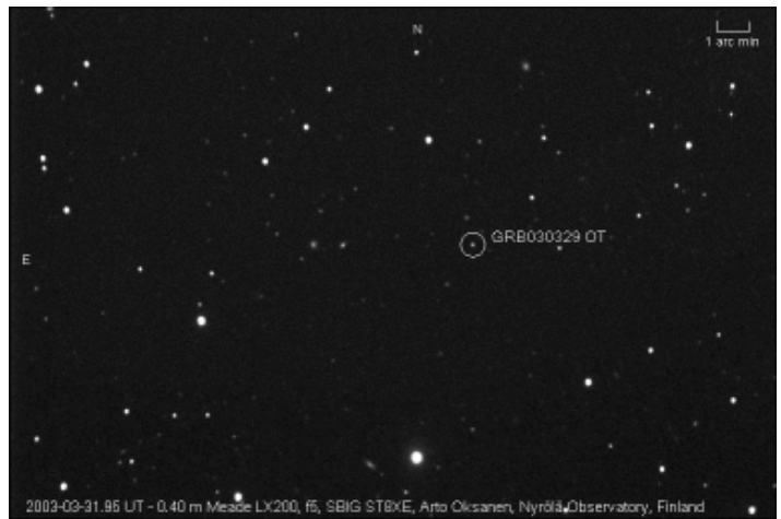
Kuva jälkihehkusta on koostettu useasta 60/120 s CCD kuvasta Re-suodatinta käyttäen.