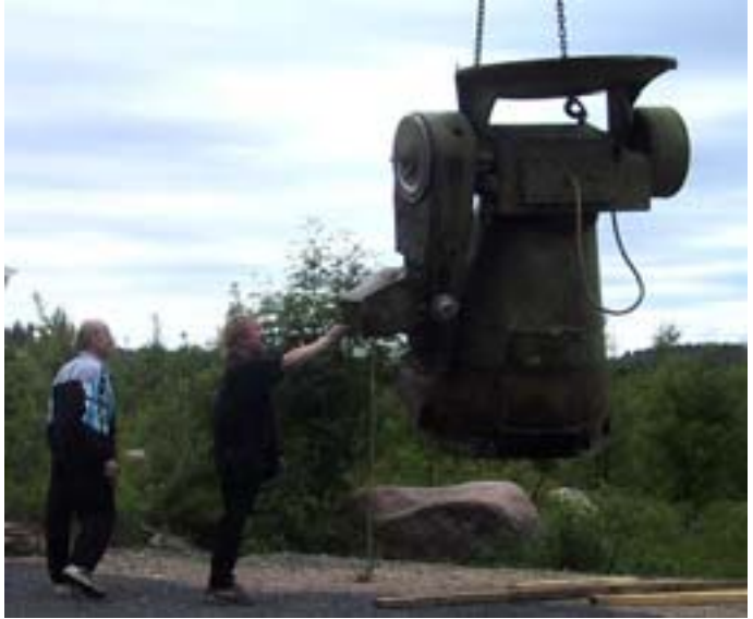
Antennin jalustaa nostetaan väliaikaisesti Nyrölän observatorion parkkipaikalle.

Nyrölän perinteiset kesätalkoot alkavat taas. Talkoiden pääasiallinen ajankohta on lauantaisin alkaen puoliltapäivin. Silloin paikalla on aina joku avaimen haltija 'työnjohtajana', joten kaikki ovat tervetulleita kantamaan korkensa yhteiseen kekkoon. Jokaiselle löytyy varmasti jotainhyödyllistä tekemistä allaolevasta listasta ja sen ulkopuoleltakin. Sirius tarjoaa talkoolaisille kahvit ja grillimakkarat. Tervetuloa mukaan!