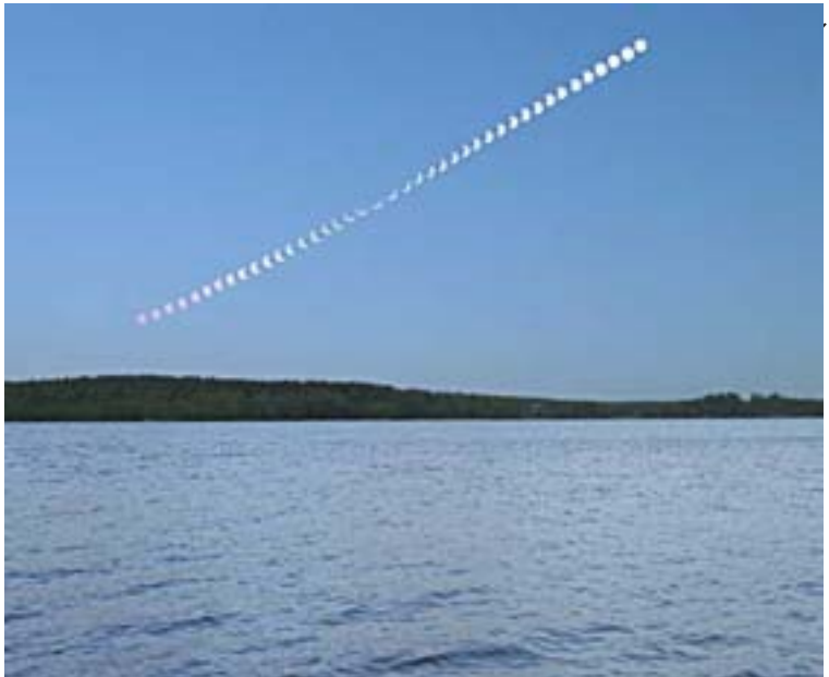
Tapio Lahtisen koostekuva pimennyksen vaiheista